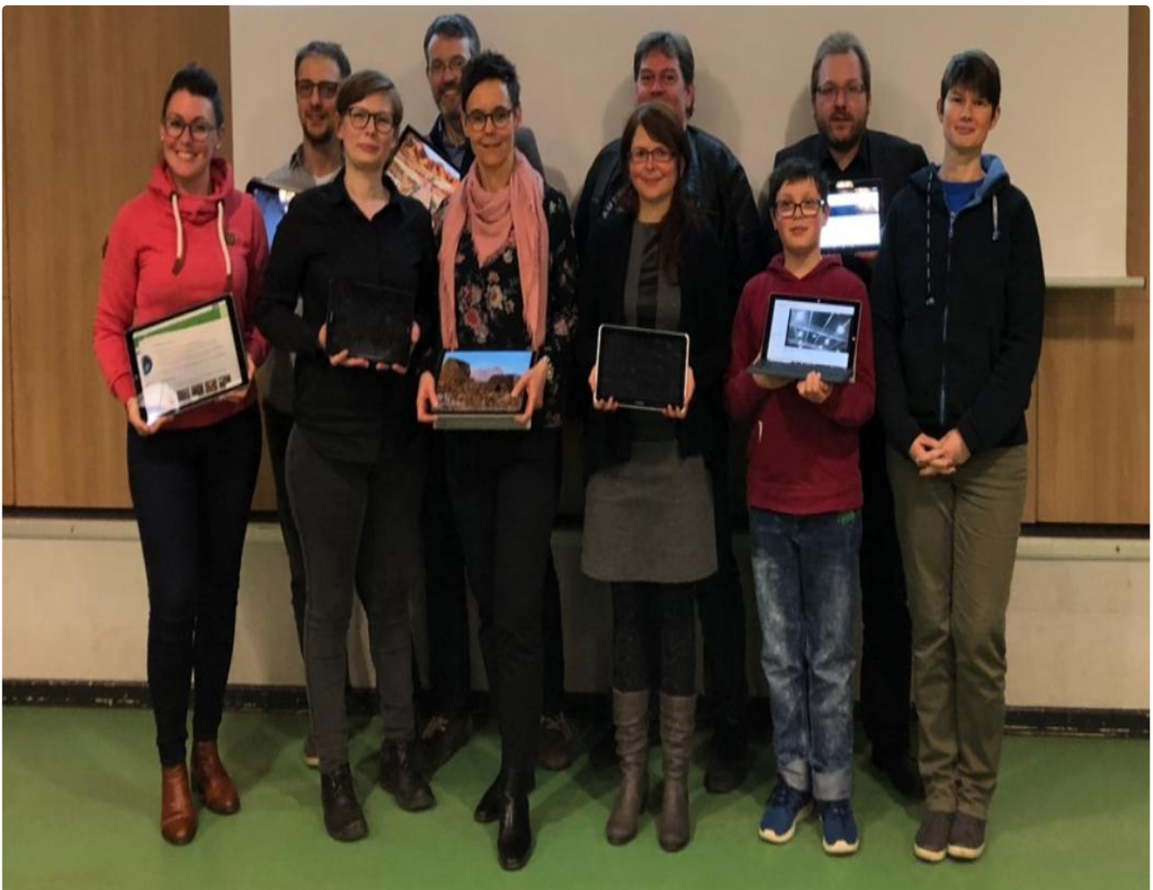
KollegInnen der IGS Lengede mit Tablets

In 18 Monaten bereitet sich die Gesamtschule auf einen optimalen Start zum Schuljahr 2018/19 vor