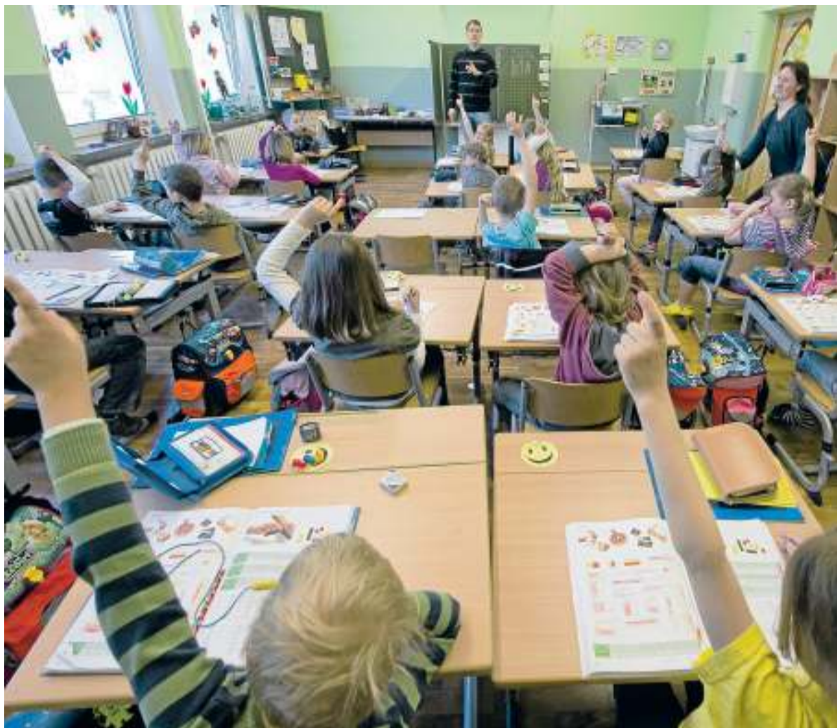
In einer ersten Klasse melden sich Kinder während des Unterrichts, das Foto wurde an einer Grundschule in Rauen in Brandenburg gemacht.

Wolf Krämer-Mandau von der Projektgruppe Bildung und Region